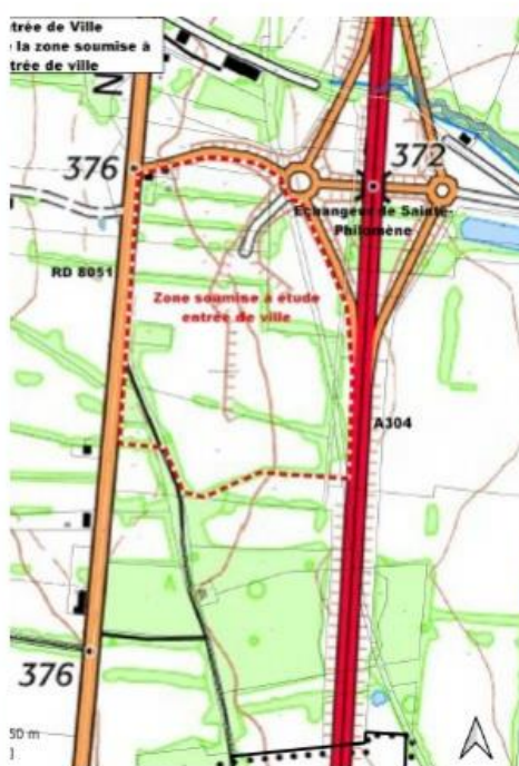
Figure 3: extrait du dossier

Une procédure de modification du PLU a été menée notamment pour ouvrir à l'urbanisation la zone « Sainte-Philomène » (2AU en 1AU) et pour laquelle l'Ae a émis un avis le 1 er avril 2021 23 .