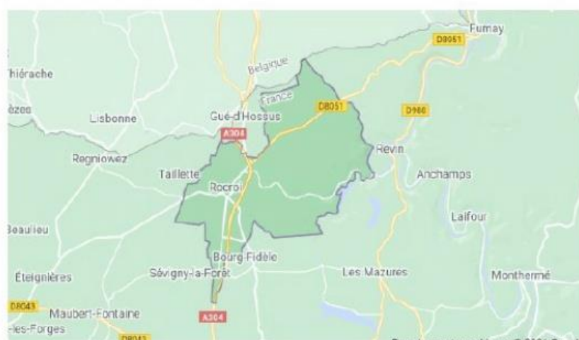
Figure 1:

Sont recensés sur la commune de Rocroi :