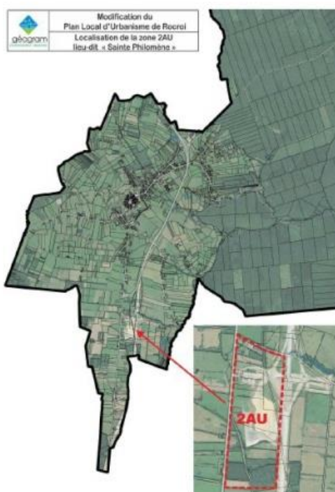
Figure 2: extrait du dossier

La commune souhaite déroger aux reculs générés par l'autoroute A304 et la RD8051 dans la zone à urbaniser « Sainte-Philomène » en passant à 15 mètres au lieu des 100 ou 75 m imposées par la réglementation. Cette zone, située au sud à environ 2,5 km de l'entrée de la commune de Rocroi, est destinée à accueillir des activités d'hébergements hôteliers, bureaux, commerces, artisans, entrepôts et industries.